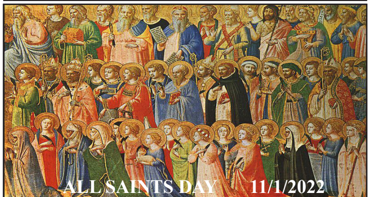
ALL SAINTS DAY 11/1/2022

The Fatima Adoration Chapel will be CLOSED from 10/31/22 - 11/4/22 due to the new door being installed. The Blessed Sacrament will be exposed from 8am to 6pm in the Church atrium in the mean time, like it was during the pandemic.