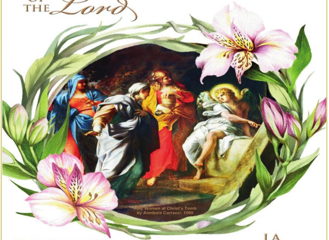
Holy Women at Christ's Tomb by Annibale Carracci, 1590

“Why do you seek the living one among the dead? He is not here, but he has been raised. ” Luke 24:5-6