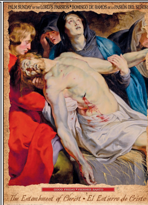
GOOD FRIDAY • VIERNES SANTO The Entombment of Christ • El Entierro de Cristo